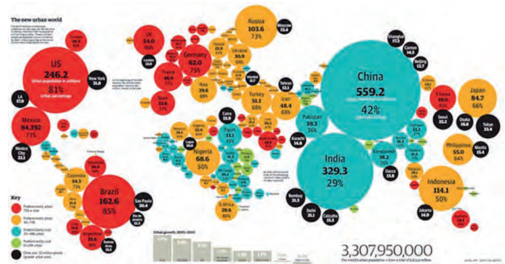
THE NEW URBAN WORLD - % de población urbana en el mundo

a la contaminación atmosférica. Más de la mitad de la población urbana mundial estuvo expuesta a niveles de contaminación del aire al menos 2,5 veces más altos que el estándar de seguridad.